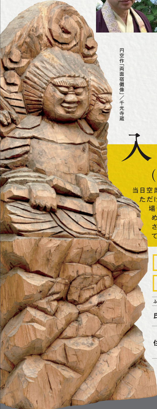
円空作「両面宿儺像」／千光寺蔵