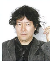
脳科学者 茂木 健一郎