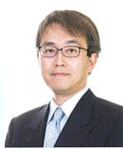
将棋棋士 羽生 善治