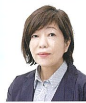
作家 林 真理子