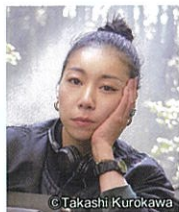
映画監督 安藤 桃子