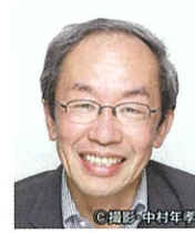
コミュニケーション工学者 東京大学名誉教授 原島 博