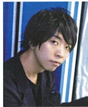
メディアアーティスト 落合 陽一