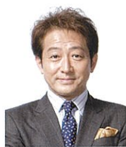
俳優 / 「日本のワインを 愛する会」会長 辰巳 琢郎