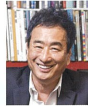
作曲家 三枝 成彰