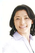
経済評論家 勝間 和代