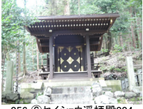
056_⑥セイショウ選拝殿004