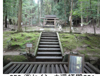
053_⑥セイショウ選拝殿001