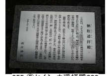
055_⑥セイショウ選拝殿003