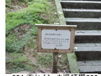
054_⑥セイショウ選拝殿002