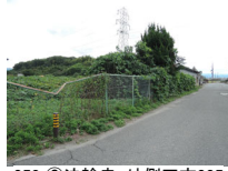
058_⑥法輪寺・外側四方005