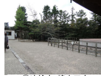
024_③法輪寺・境内四方006