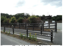
061_⑥法輪寺・外側四方008