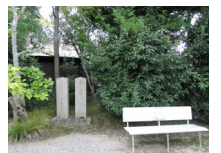
050_⑤法輪寺・本堂の脇・四方008