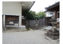
045_⑤法輪寺・本堂の脇・四方003