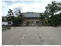
028_③法輪寺・境内四方010