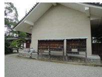
044_⑤法輪寺・本堂の脇・四方002