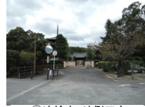
054_⑥法輪寺・外側四方001