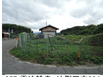
057_⑥法輪寺・外側四方004