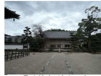
019_③法輪寺・境内四方001