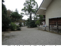
053_⑤法輪寺・本堂の脇・四方011