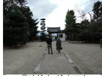
023_③法輪寺・境内四方005