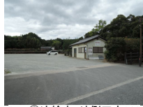
063_⑥法輪寺・外側四方010