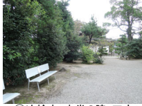
052_⑤法輪寺・本堂の脇・四方010