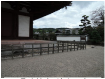
026_③法輪寺・境内四方008