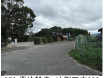
056_⑥法輪寺・外側四方003