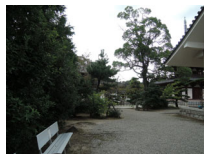
043_⑤法輪寺・本堂の脇・四方001