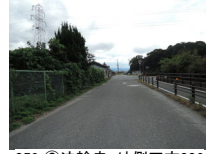
059_⑥法輪寺・外側四方006