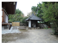
048_⑤法輪寺・本堂の脇・四方006