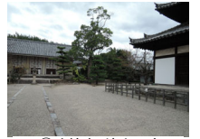
020_③法輪寺・境内四方002