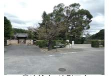
055_⑥法輪寺・外側四方002