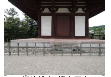
025_③法輪寺・境内四方007