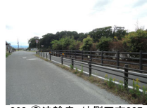
060_⑥法輪寺・外側四方007