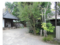
049_⑤法輪寺・本堂の脇・四方007