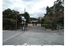
065_⑥法輪寺・外側四方012