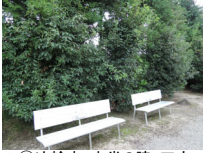
051_⑤法輪寺・本堂の脇・四方009