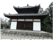
021_③法輪寺・境内四方003