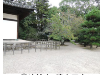
022_③法輪寺・境内四方004