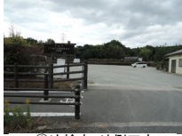
062_⑥法輪寺・外側四方009