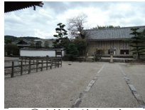
027_③法輪寺・境内四方009