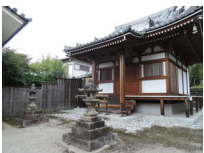
046_⑤法輪寺・本堂の脇・四方004