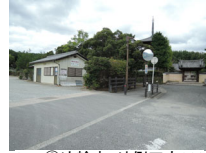
064_⑥法輪寺・外側四方011