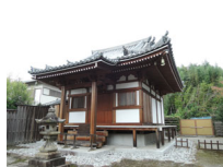
047_⑤法輪寺・本堂の脇・四方005