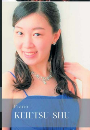
Piano KEIETSU SHU