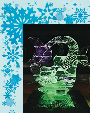
清澄の国ぞみ芸術祭 アートラボきふ