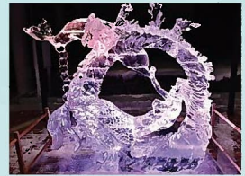
※写真は過去のもです。